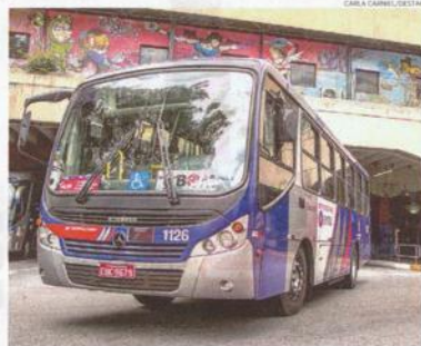
Se aprovada, nova lei vai abranger transportes terrestre e hidroviário do SP