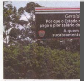
Campanha. Em outdoors, delegad